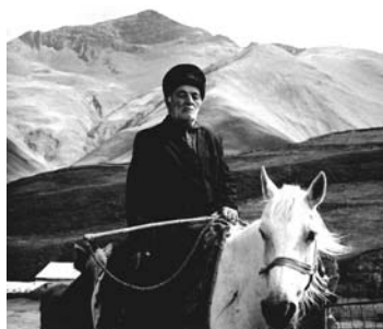
RENA EFFENDI - AZERBAIJAN - 2006