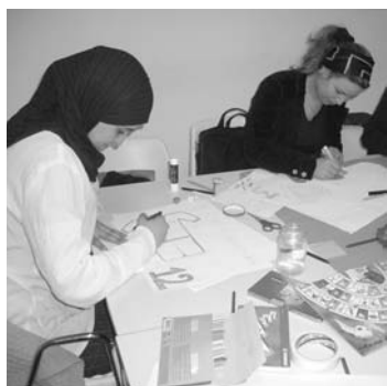
Ricerca di dialogo tra Islam e Occidente in due romanzi

Riflessioni su tecnologie informatiche e complessità del gestire tempo individuale e sociale. Passeggiando nella piazza di San Vito al Tagliamento perfettamente recuperata