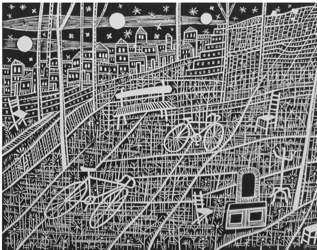
LUIGI SPACAL - LA VALLE DELLE TRE LUNE - 1943

La mostra "Spacal, dall'identità al segno", aperta fino al 19 agosto, intende essere un omaggio al grande artista sloveno nel centenario della nascita. Vi sono esposte un'ottantina di incisioni appartenenti alla collezione dell'Azienda Agrituristica "Ai Colonos" di Villacaccia di Lestizza, a cui fa capo l'omonima Associazione Culturale, da anni impegnata nella difesa dell'identità culturale, non solo friulana. Del resto Luigi Spacal (Trieste 1907-2000) è il maggiore