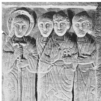
Promesse per Aquileia Madiere un romanzo postumo