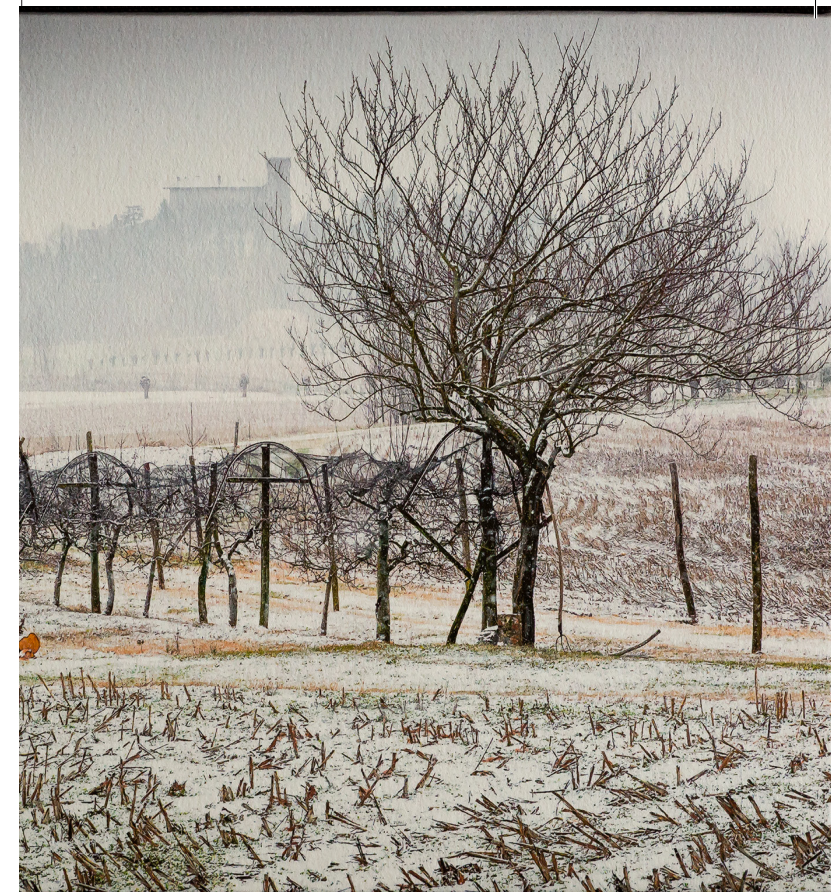
Villalata, 2018, part.

2° supplemento al n. 520 (Settembre 2019 - Anno 50°). Sped. in a.p. 45%. Legge 662/96 art. 2 comma 20/b. Filiale di Pordenone - Redazione 7, via Concordia 33170 Pordenone. Telefono (+39) 0434.365387. Aut. del Trib. di Pordenone n. 71 del 2 luglio 1971. Direttore responsabile Luciano Padovese. Stampa Tipografia Sartor srl - Pordenone, Art. 7 d. lgs. n. 196/2005. I suoi dati sono usufruiti da Presenza e Cultura Pordenone per informazione sulle attività promosse dall'Associazione. L'art. 13 le conferisce il diritto di accesso, integrazione, aggiornamento, correzione, cancellazione e di opposizione, in tutto o in parte, al trattamento dei dati. Titolare del trattamento: Presenza e Cultura Pordenone, via Concordia 7.