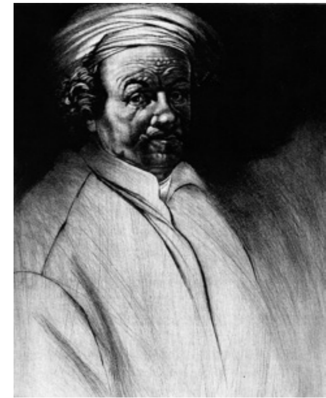
Rembrandt, 1990, ps., mm 501x401

solo la potenza dell'incedere del cavaliere. Così di Rembrandt sono ripresi soprattutto i ritratti della vecchiaia, nei quali il pittore si considera con occhio sempre più problematico.