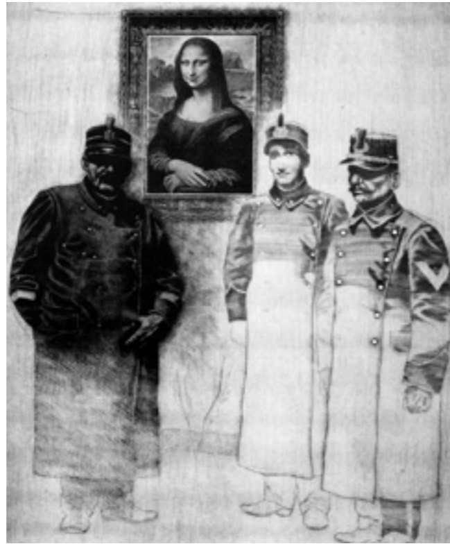
La Gioconda recuperata dai carabinieri, 1982, ps. mezzotinta e fotoincisione, mm 601x501

che genere di realtà Dugo tematizzi, in che modo si pongano i suoi interrogativi e anche le sue soluzioni estetiche.