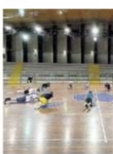
PALLACANESTRO Stagione finita anche per la Humus Sacile

Giovedì sera è arrivato lo stop definitivo del presidente federale Giovanni Petrucci a tutte le attività cestistiche regionali, in tutta Italia, a livello senior e giovanile. La stagione agonistica 2019-2020 finisce quindi in archivio già nel mese di marzo, senza assegnare quasi niente e questo varrà molto probabilmente anche per i campionati nazionali. Da giorni viene data per certa l'interruzione della serie B, chiesta peraltro dalle stesse società che vi partecipano. E, nonostante le voci e dichiarazioni discordanti, la stessa sorte dovrebbe toccare pure alla serie A e alla serie A2. Sindici a pagina III