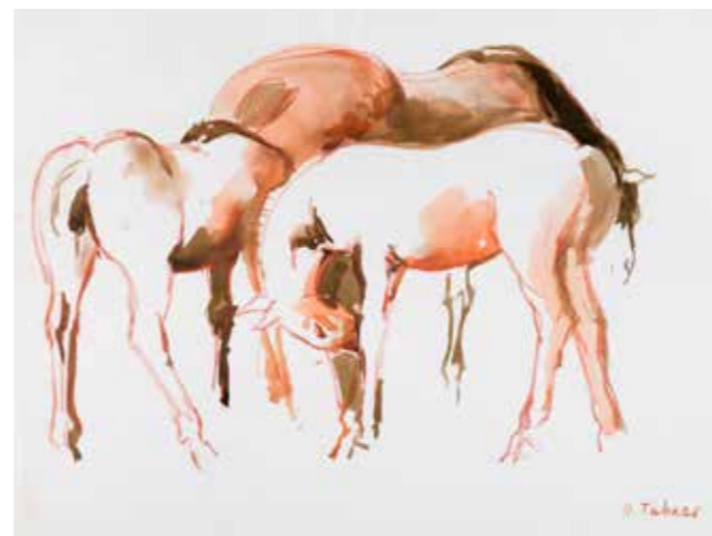
Cavalli, anni '70, china e sanguigna su carta, cm 35x50,5

Renzo Tubaro è nato a Codroipo nel 1925, è scomparso a Udine nel 2002. Ha frequentato l'Accademia di Venezia, avendo per maestro Guido Cadorin. Ha esposto più volte alla Quadriennale di Roma, alle Biennali di Arte Triveneta di Padova, Verona e Campione d'Italia, alle Triennali delle Arti a Villa Simes e in molte altre collettive e personali. Sue opere sono alla Galleria d'Arte Moderna di Venezia, di Udine, al Castello Sforzesco di Milano ed in varie altre collezioni pubbliche e private. Vasti cicli di affreschi si trovano in molte chiese del Friuli.