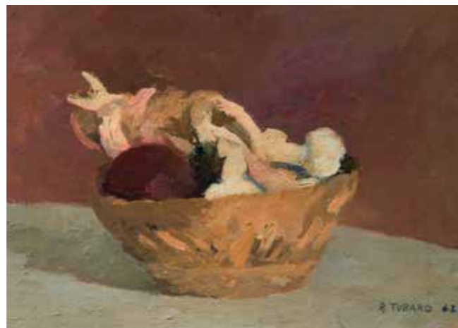
Cestino con aglio, 1962, olio su faesite, cm 29x42