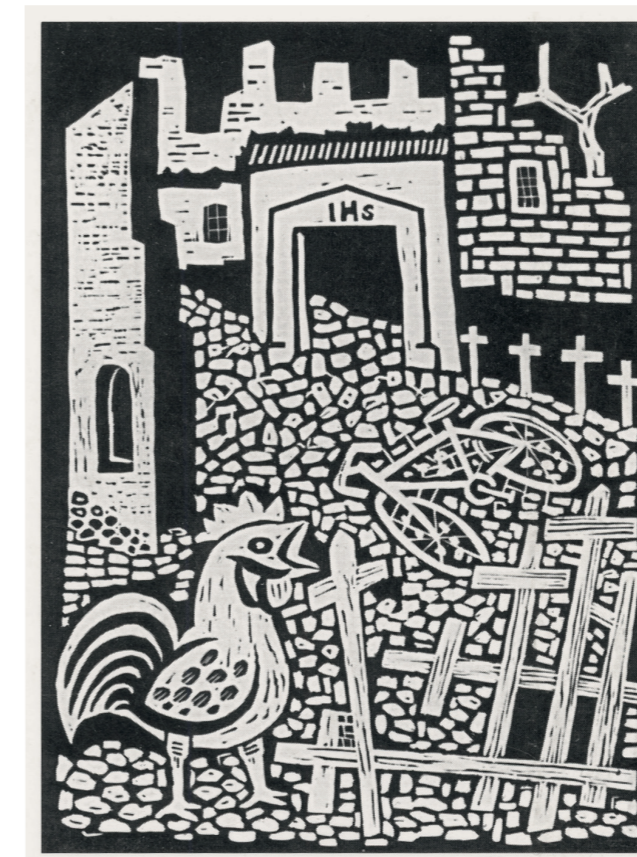
Luigi Spacal, Macerie sul Carso , 1946, xilografia, mm 250x180

La poesia di Spacal si rivedrà, dopo parecchio tempo, in alcune piccole immagini intrise della straordinaria poesia del Carso, mentre altre immagini più recenti potranno confermare la costante capacità lirica di questo nostro fondamentale artista.