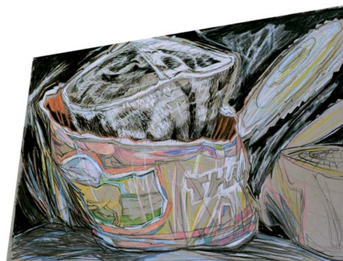
Simmenthal con il pelo , 1996-97.

almeno a giudizio di chi scrive, evidente metafora dello spazio, e del tempo, della vita.