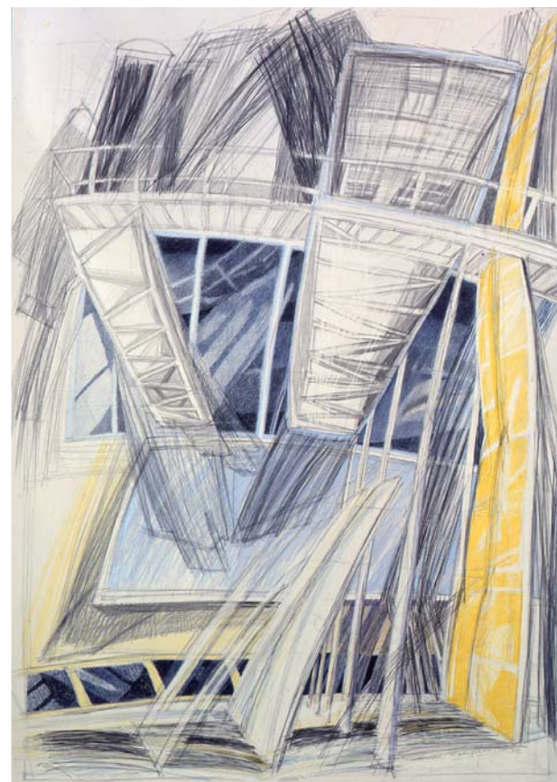
Stiva , 1993.

Le cose, nella pittura di Mirella Brugnerotto, "accadono". Si fermano nel momento in cui vengono fissate sulla tela, provenendo da un tempo appena trascorso, ma già volgendosi al tempo successivo, in direzione del quale è il dinamismo stesso che le percorre - come una sorta di elettricità - a travolgerle: ciò che appunto carica lo spazio della tela - che è il palcoscenico di questo accadere - di una integrale inquietudine, di una provvisorietà che è,