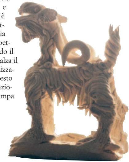
La capra, anni '70

Questo rapporto tra gesto, campitura e idea formalizzata è costante nella pittura di Belluz, varia soltanto nelle rispettive densità: quando il gesto si riduce, si alza il grado di formalizzazione, quando questo diminuisce l'intenzione emotiva si accampa più visibilmente sulla tela.