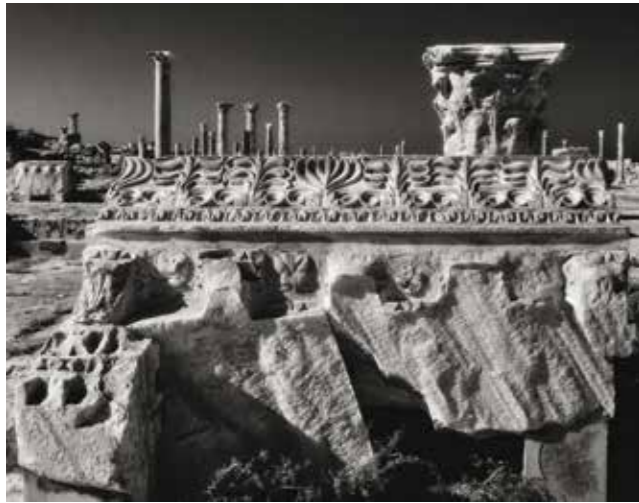
Fregio del Tempio Sud, Sabratha, ottobre 2002

O come quella della Basilica Occidentale di Apollonia, la cui cadenza “matematica” si confronta intensamente con l’andatura temporalesca di un cielo, che peraltro non riesce a sconfiggere, attraverso la mobile figurazione delle sue nuvole, il ritmo serrato, ribattuto delle colonne.