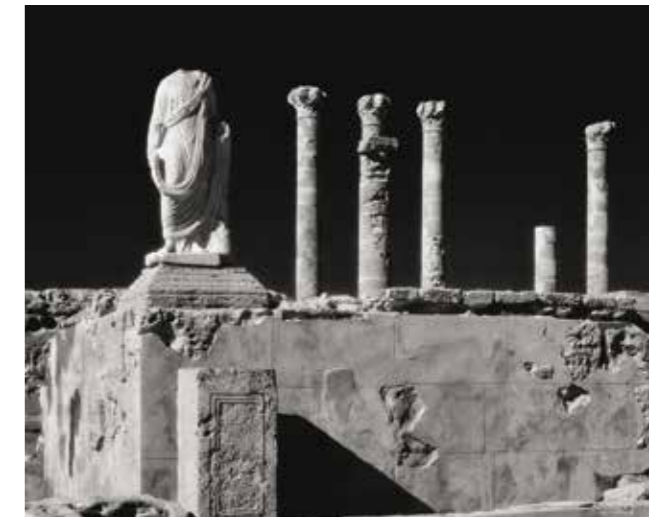
Fontana di Flavio Tullio, Sabratha, ottobre 2002

Così si spiegano, io penso, immagini come quella del Foro di Sabratha: ne rimane il piano, colonne mozzate, colonne che giungono fino ai capitelli, ma spazi e volumi sono bilanciati in una tale equilibrata precisione da far completamente dimenticare a chi guarda che appunto di rovine si tratta, come se il fotografo riuscisse a risarcire le distruzioni del tempo attraverso una sorta di volontà ricostruttiva che ridà intero il senso dell’antica armonia.