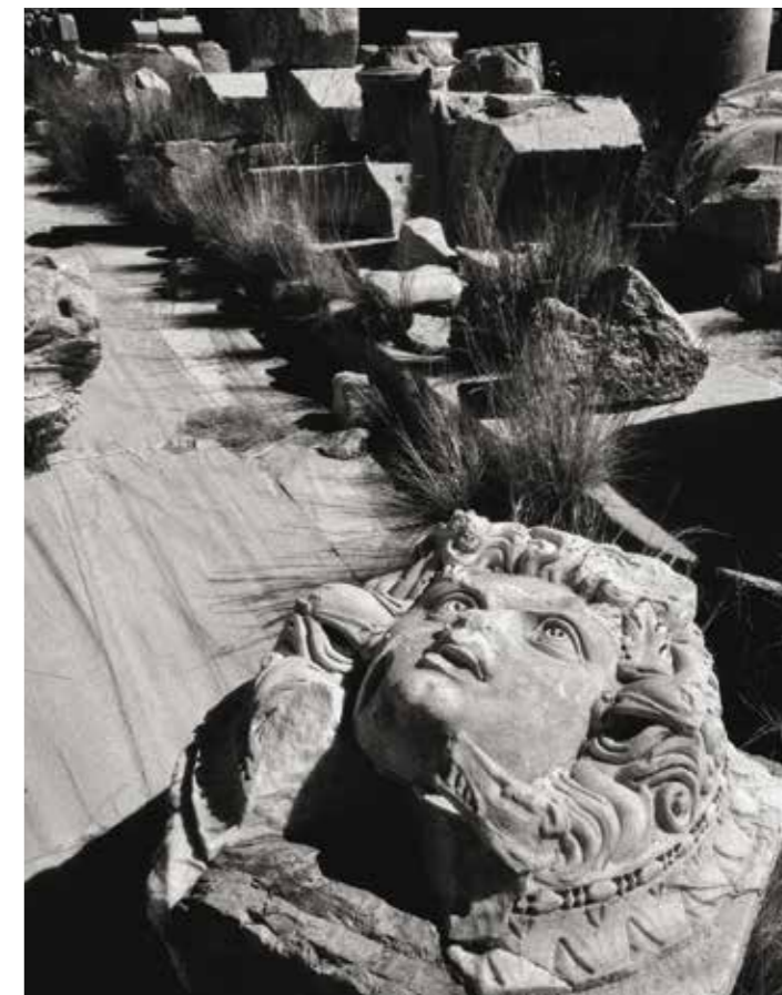
In copertina: Nuovo Foro Severiano, Leptis Magna, ottobre 2002

Presenza e Cultura pec@centroculturapordenone.it tel. 0434.365387 www.centroculturapordenone.it facebook.com/centroculturapordenone.it