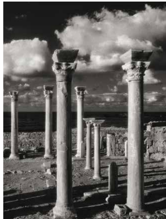
Basilica Centrale, Apollonia, ottobre 2002

Nè è soltanto la presenza dei volti, o della figura, a rendere così pregne di senso queste immagini.