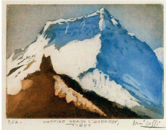
Mattino verso l'Everest, Tibet, act.

diventare la realtà rappresentata quasi un cristallo dipinto, fermato per sempre in una luce che è nello stesso tempo vera e sognata.