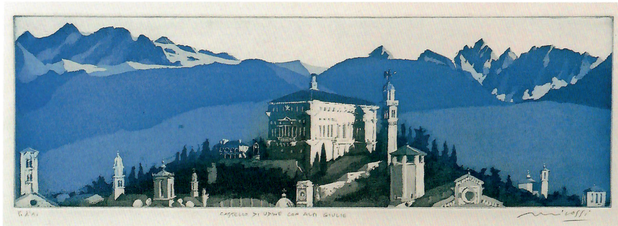
Castello di Udine con Alpi Giulie, act.

Il grande amore dell'artista per la montagna è testimoniato da una lunga serie di incisioni impostate per lo più dal vero, e dalle quali si comprende bene come il suo interesse non sia solo per le pareti scoscese e per le vette, ma per tutto il paesaggio, il “mondo” della montagna, con valli fiumi e paesi, con vedute che spesso si allargano dalla pianura per