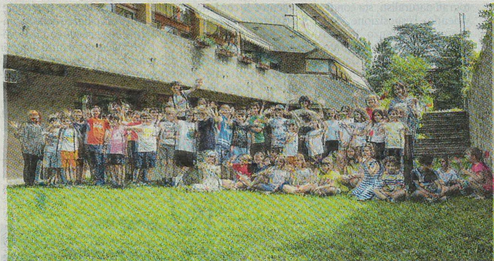
Due immagini delle attività e della festa estiva di Casa Zanussi in via Concordia

Buona la prima, in via Concordia, alla Casa dello studente Zanussi di Pordenone, per gli spazi laboratoriali ampi, luminosi e climatizzati con l'energia del fotovoltaico. Il giardino è ombreggiato dai grandi alberi e piacevolmente ventilato, i docenti, il personale e gli studenti di dell'istituto superiore Flora e del liceo Grigoletti in Peto (percorsi per le competenze trasversali e l'orientamento, vale a dire l'ex alternanza scuola-lavoro) hanno creato un mix vincente.