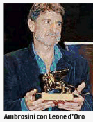
Ambrosini con Leone d'Oro

Il dialogo a più voci sui caratteri di stile e problemi di comunicazione della critica d'arte, ideato e condotto dal critico d'arte Fulvio Dell'Agnesse, coinvolgerà dunque quest'anno il grandissimo compositore Claudio Ambrosini, Leone d'Oro