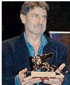
Ambrosini con Leone d'Oro

Il dialogo a più voci sui caratteri di stile e i problemi di comunicazione della critica d'arte, ideato e condotto dal critico d'arte Fulvio Dell'Agnese, coinvolgerà dunque quest'anno il grandissimo compositore Claudio Ambrosini, Leone d'Oro alla Biennale Musica, fra i primi sperimentatori di video-arte negli anni '70 e autore nel 2015 di Mor-te di Caravaggio, copia dal vero per fagotto e orchestra. Ma sarà anche occasione per ripercorrere la tradizione editoriale di storiche gallerie d'arte come il "Cavallino" di Venezia, al centro dell'intervento di Giovanni Bianchi. Sono aperte le prenotazioni per assistere al convegno, ingresso libero info Centro Iniziative Culturali Pordenone cicp@centroculturapordenone.it www.centroculturapordenone.it facebook.com/centroculturapordenone youtube.com/CulturaPn .