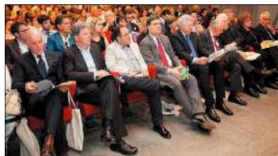
INVITATI Parterre di autorità alle premiazioni del concorso "Europa&Giovani"

PORDENONE - Si avvia al rush finale l'edizione 2017 del Concorso "Europa&Giovani", promosso dall'Irse - Istituto regionale di studi europei di Pordenone. Centinaia di studenti di tutta Italia, ma anche di Francia, Gran Bretagna, Danimarca e Slovenia, hanno scelto di parteciparvi in occasione dei 60 anni dai Trattati di Roma, primo passo per la nascita dell'Unione europea. Altissima l'adesione degli atenei italiani, affiancati dal prestigioso Istituto di Studi Politici-ScienzePo di Parigi, dalla University of Aberdeen e dalla Copenhagen Business School. Domani, alle 10, il