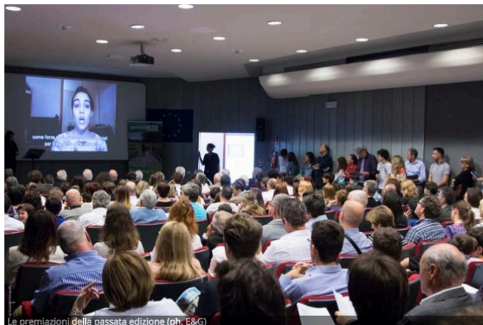
Le premiazioni della passata edizione

Domenica la cerimonia di premiazione per l'evento che ha coinvolto centinaia di giovani da Italia, Francia, Gran Bretagna, Danimarca e Slovenia